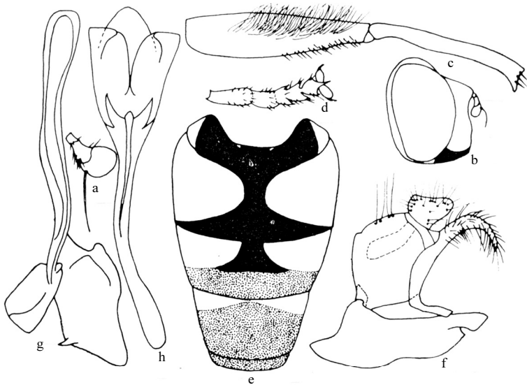
图 323 长茎粉颜蚜蝇 Mesembrius longipennis Li (仿 Li, 1996)

a. 触角 (antenna) b. 头部 (侧面观) (head in lateral view) c. 中足腿节和胫节 (middle femur and tibia) d. 中足跗节 (middle tarsus) e. 腹部 (背面观) (abdomen in dorsal view) f. 雄性外生殖器 (侧面观) (male genitalia in lateral view) g. 阴茎 (侧面观) (aedeagus in lateral view) h. 阴茎 (腹面观) (aedeagus in ventral view)